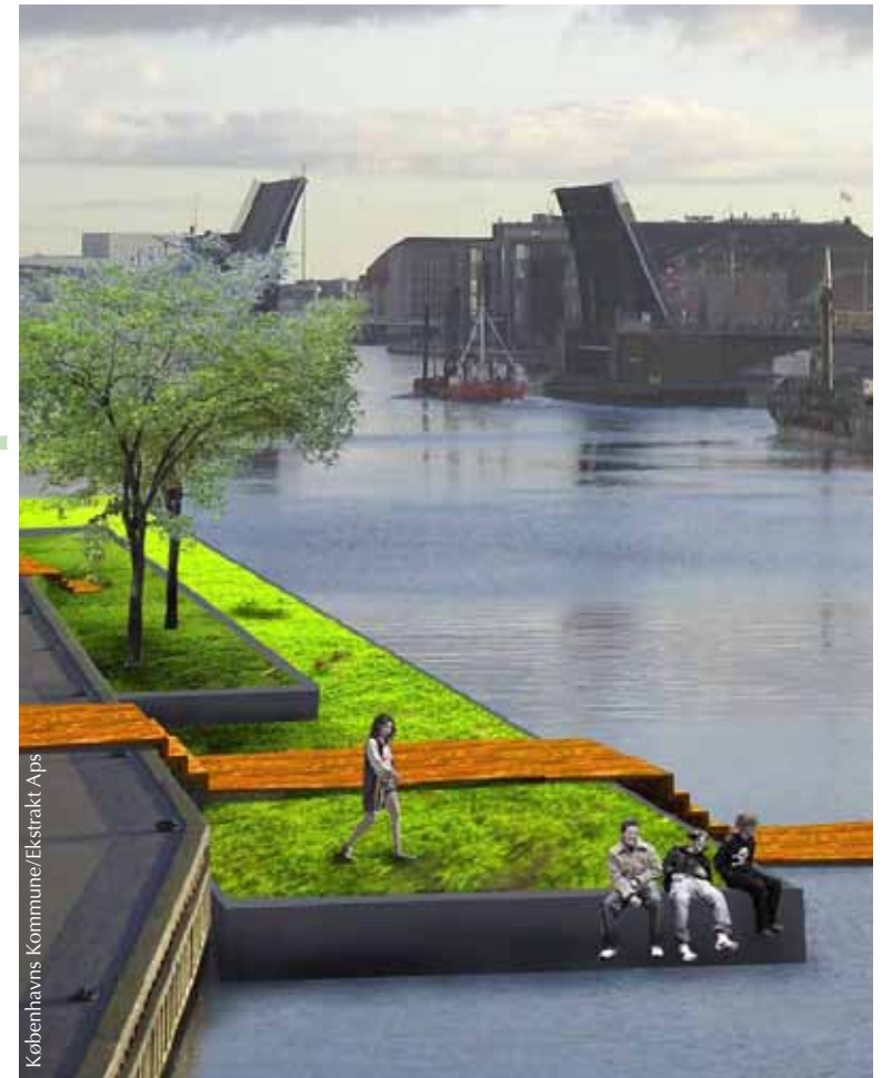
Københavns Kommune/Ekstrakt Aps